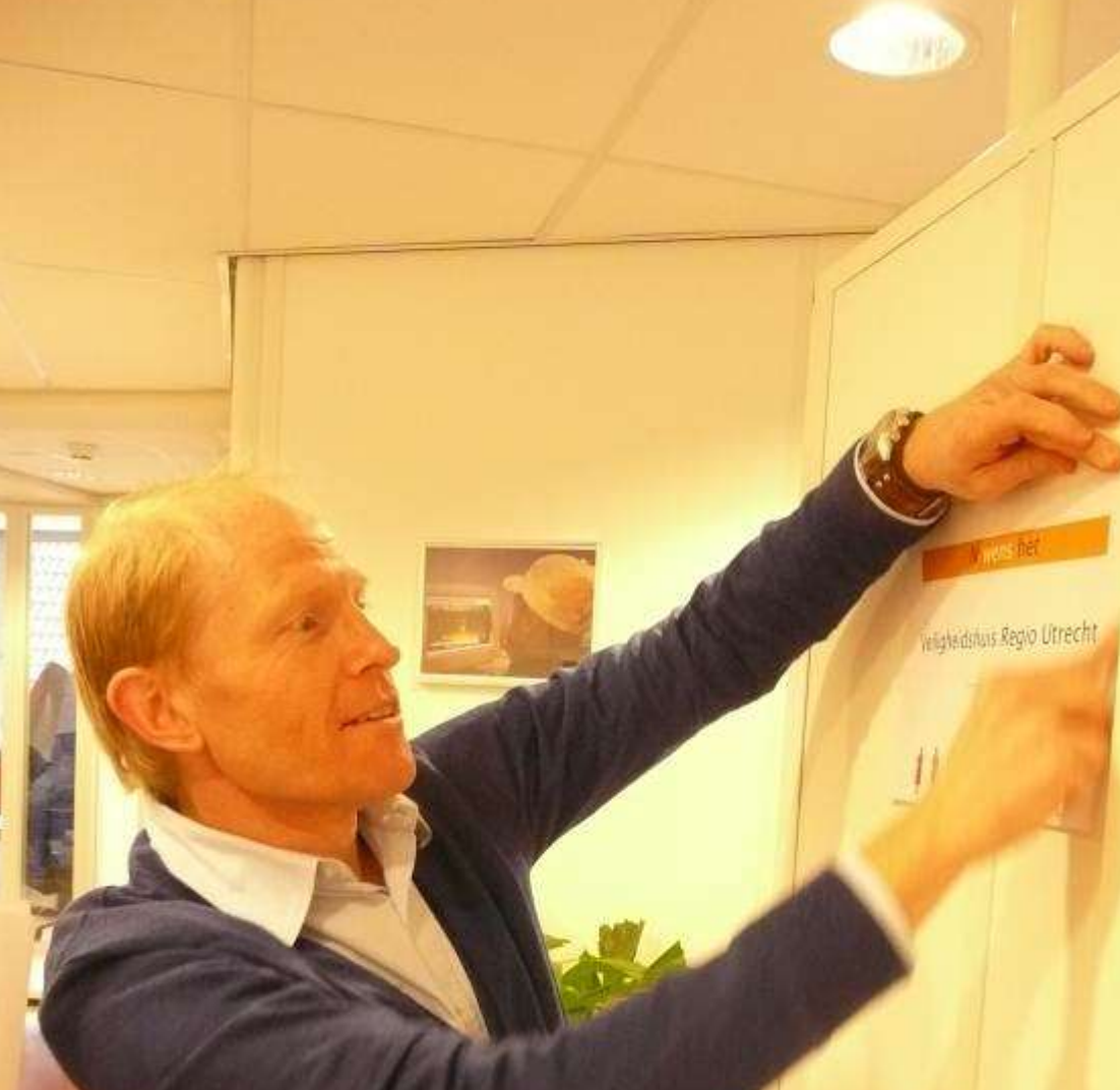
De laatste voorbereidingen worden getroffen ...