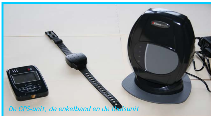
De GPS-unit, de enkelband en de thuisunit

Er zijn twee soorten enkelbanden, de gewone enkelband en de GPS enkelband. Bij een gewone gaat om de controle van een locatiegebod (en vorm van huisarrest) Met de GPS enkelband kan sprake zijn van meerdere geboden en/of verboden locaties.